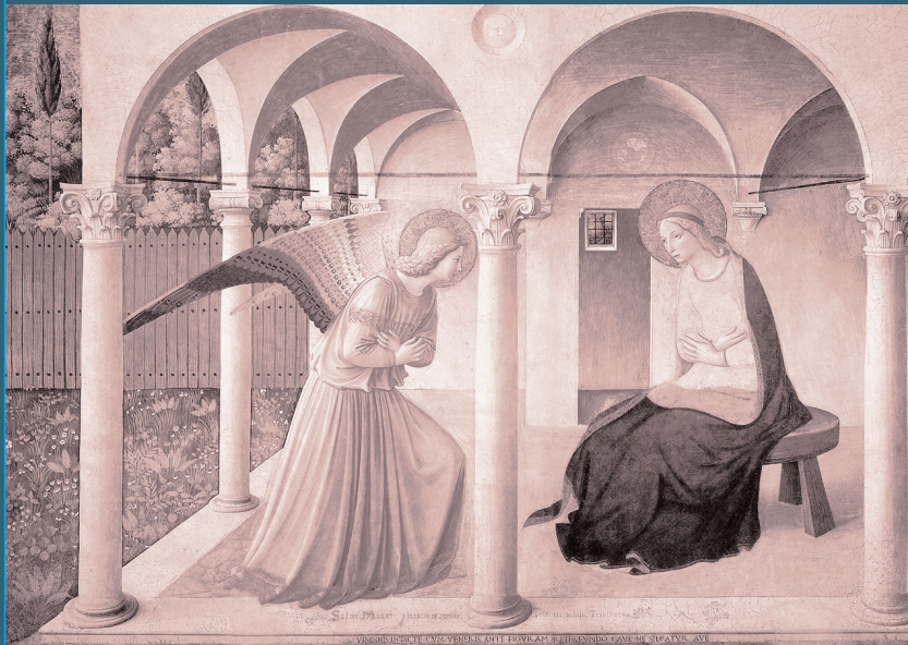
Fra Angelico, Annunciation , 1442